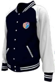
CASACA DE BUZO (Estilo Varsity Jacket )

Con el objetivo de modernizar y mejorar la comodidad y funcionalidad del uniforme de uso diario, hemos diseñado un nuevo modelo que entrara en vigencia a partir marzo 2025. Este nuevo uniforme ha sido desarrollado tomando en cuenta las sugerencias de estudiantes, padres y el personal docente, con el fin de proporcionar comodidad y una mejor experiencia para todos. El nuevo modelo estará disponible a partir de diciembre del presente año.